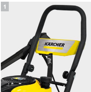
1 Складная рама