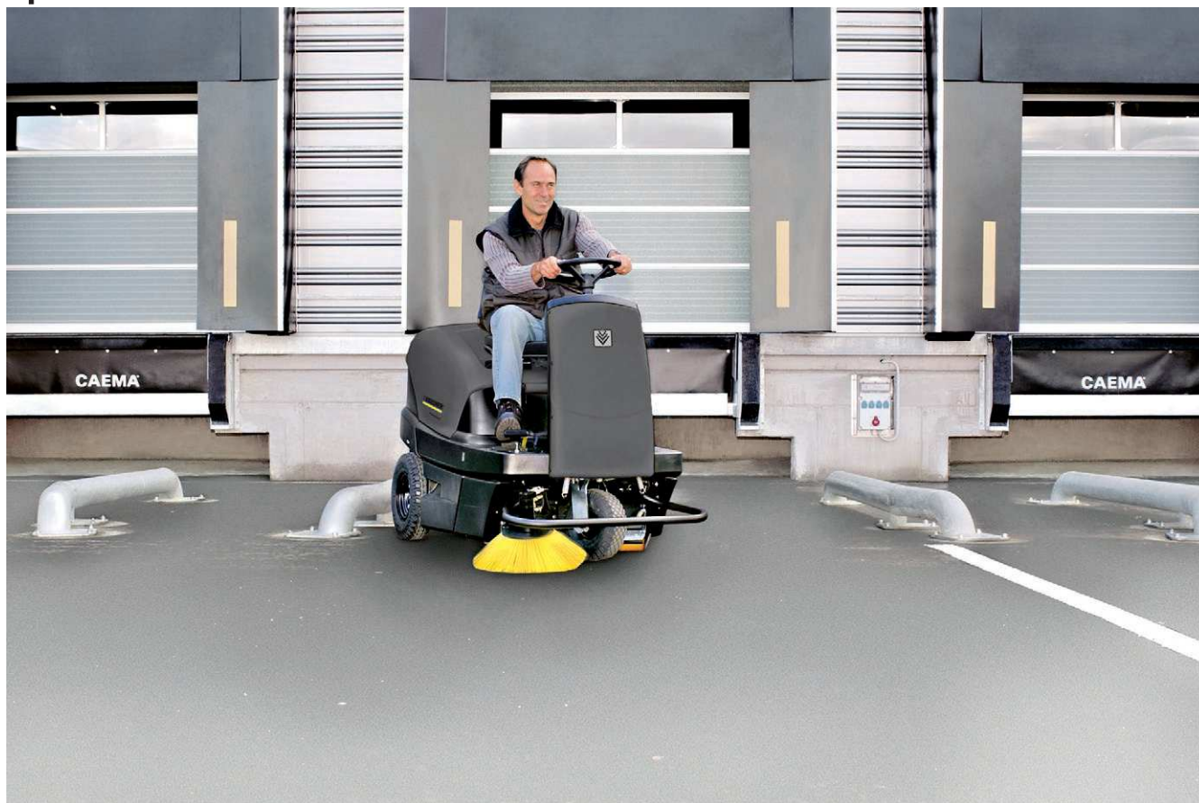
KM 100/100 R Vp

■ Система автоматической очистки фильтра