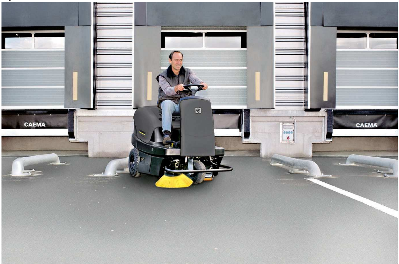
KM 100/100 R P

■ Система автоматической очистки фильтра