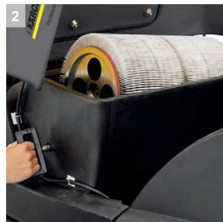
2 Фильтр большой площади с устройством автоматической очистки.