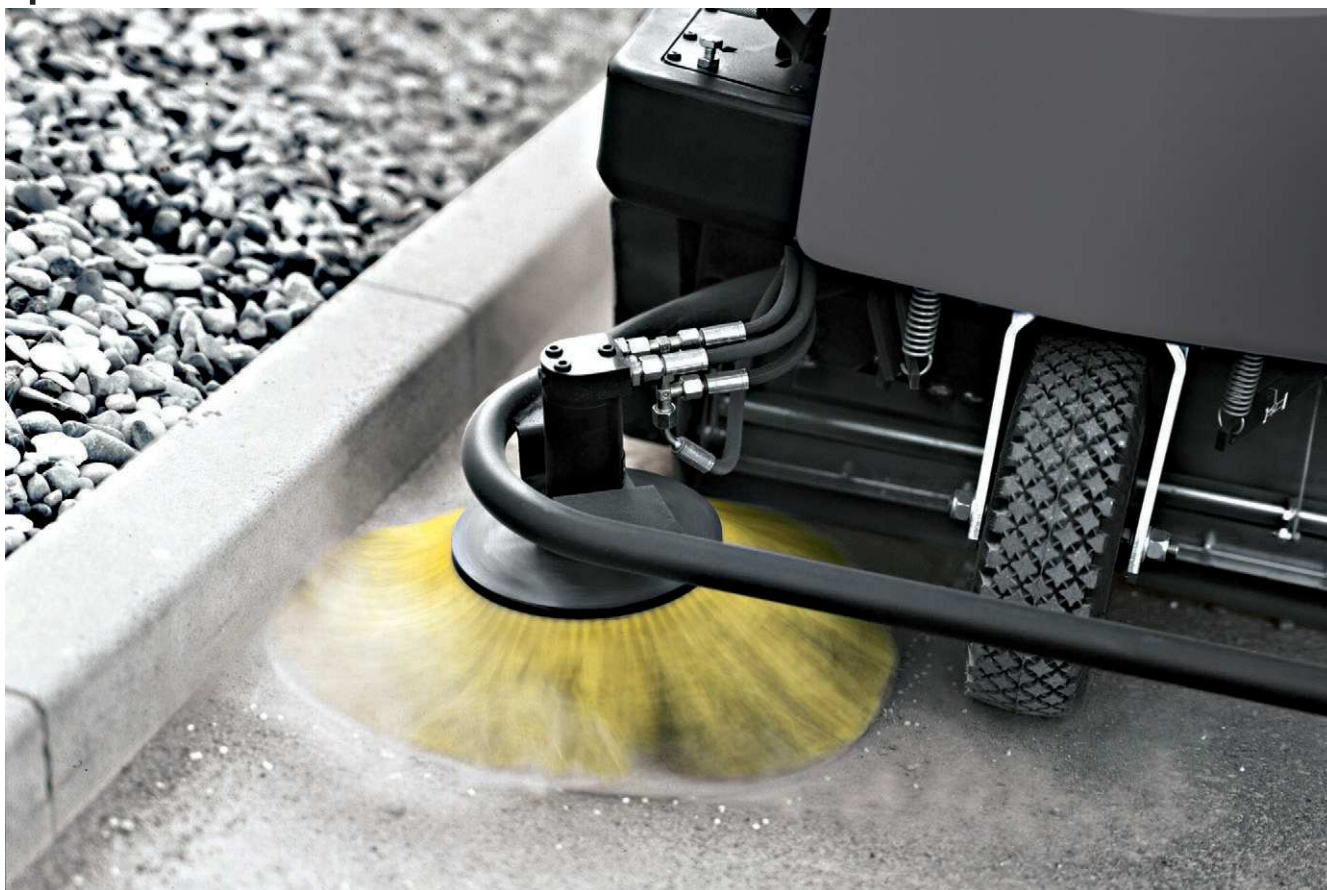
KM 100/100 R Vp Pack

■ Система автоматической очистки фильтра