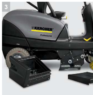
3 Простота обслуживания