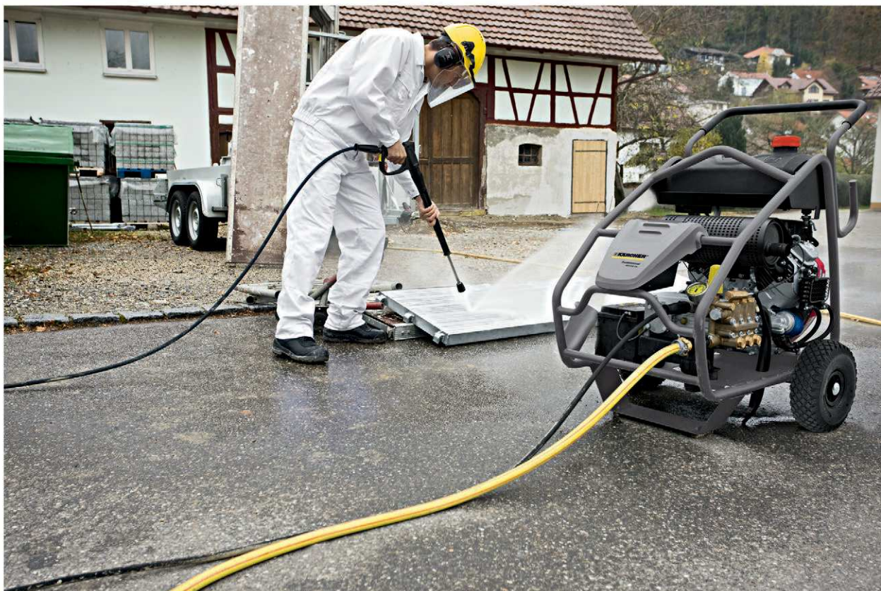
HD 13/35 Pe