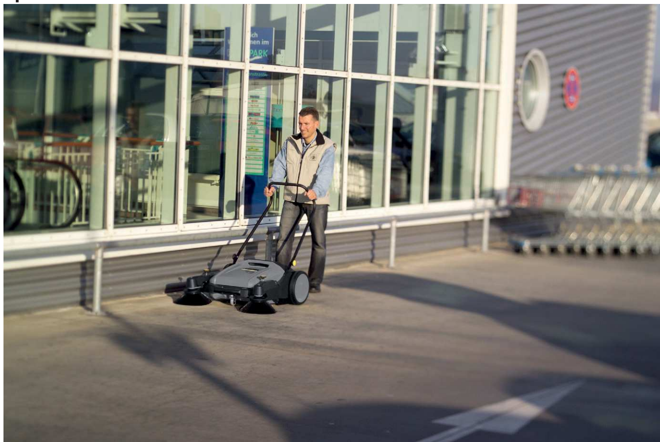
KM 70/20 C

■ Двусторонний привод цилиндрической щетки (обоими колесами)