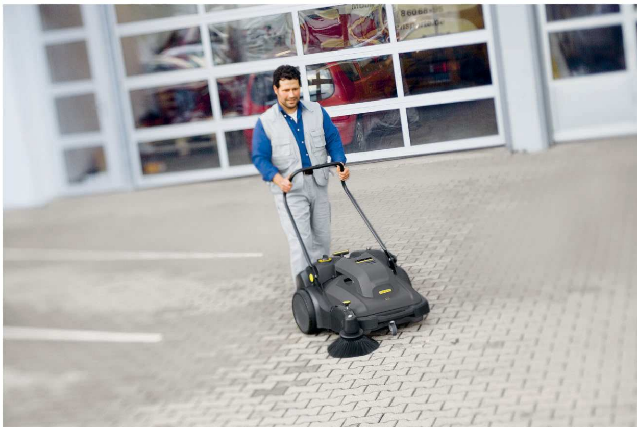
KM 70/30 C Bp Pack Adv

■ Электропривод цилиндрической и боковой щеток